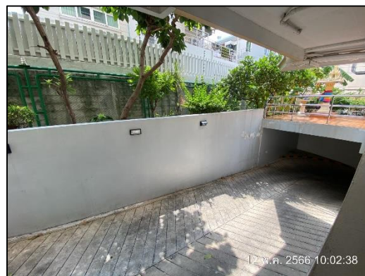
ภาพที่ 1.6-1 สถานภาพโครงการในปัจจุบัน